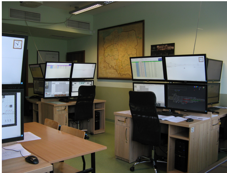
Rys. 1. Widok ogólny LIRK

Z uwagi na bliskie sąsiedztwo stanowisk, aktualnie zrezygnowano z pełnego odwzorowania głosowej łączności radiowej przez symulator, którą zastępuje bezpośrednie porozumiewanie się uczestników symulacji. Na stanowiskach przewidziano natomiast schematyczny podgląd rzeczywistego stanu zewnętrznych urządzeń srk i ruchu pojazdów, co jest szczególnie istotne w razie wystąpienia sytuacji nietypowych.