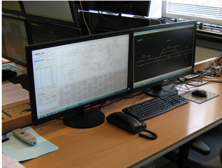
Rys. 2. Widok stanowiska instruktora LIRK

Zdarzenia nietypowe związane z taborem obejmować mogą np. symulację defektu pojazdu trakcyjnego, bezwzględne polecenie zatrzymania (STOP) i jego odwołanie, nakaz odjazdu przed rozkładową godziną czy też zignorowanie sygnału „Stój”. Bezwzględne polecenie zatrzymania może być wykorzystane do opóźnienia odjazdu pociągu lub do jego zatrzymania na szlaku, co pozwala na symulację różnych sytuacji nietypowych takich jak np. zerwanie sieci trakcyjnej czy przeszkoda na torze. Instruktor ma również możliwość nadania sygnału ALARM, który działa jak bezwzględne polecenie zatrzymania dla większej liczby pociągów. Na rys. 3. przedstawiono wygląd okna służącego do wykonywania poleceń i wywoływania zdarzeń nietypowych dla taboru.